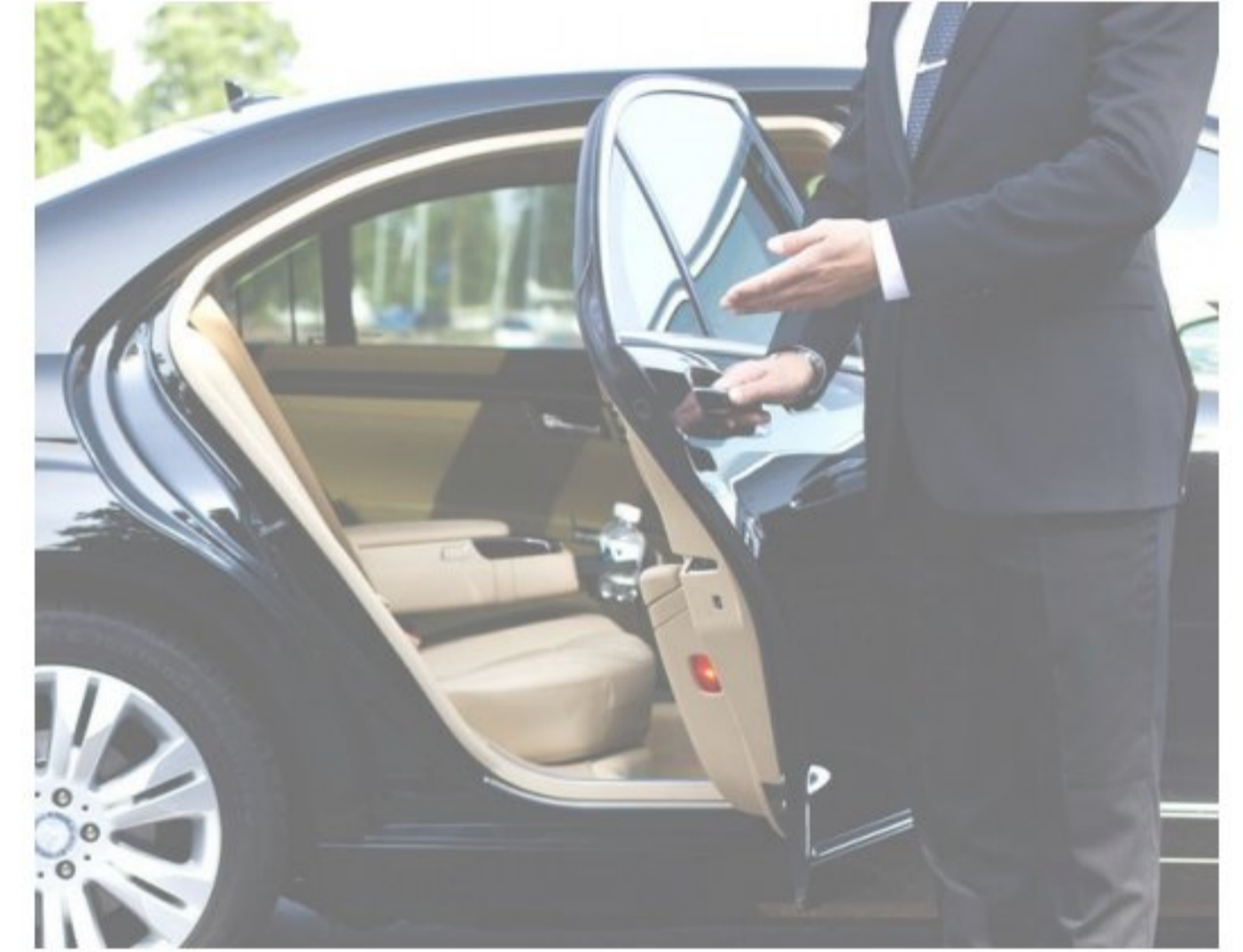
Choferes del servicio familiar