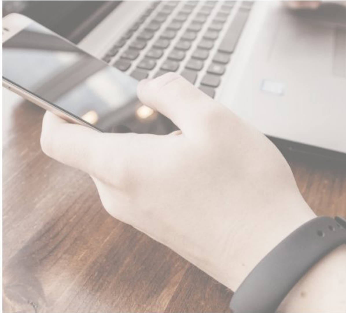
Trabajadores dependientes y subordinados