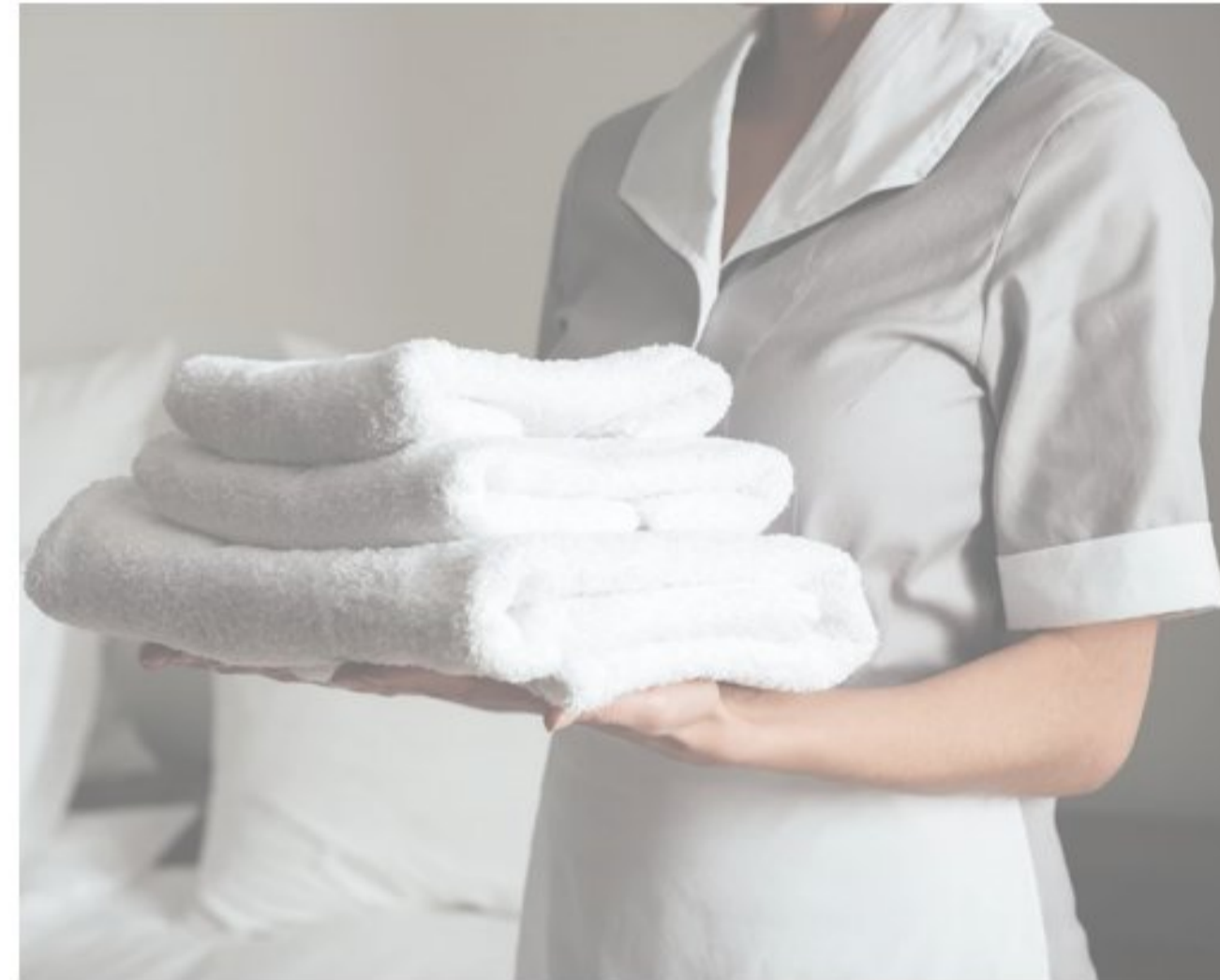
Personal del servicio doméstico