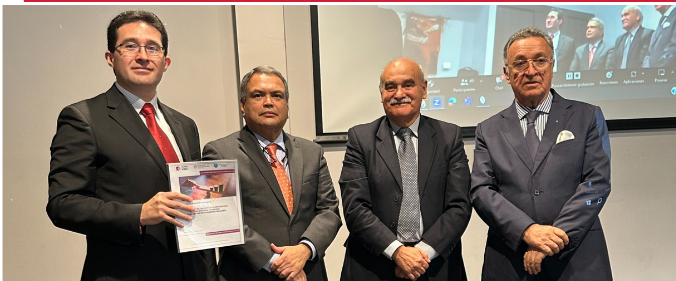
Entrega del documento borrador de Orientación Técnica No. 21